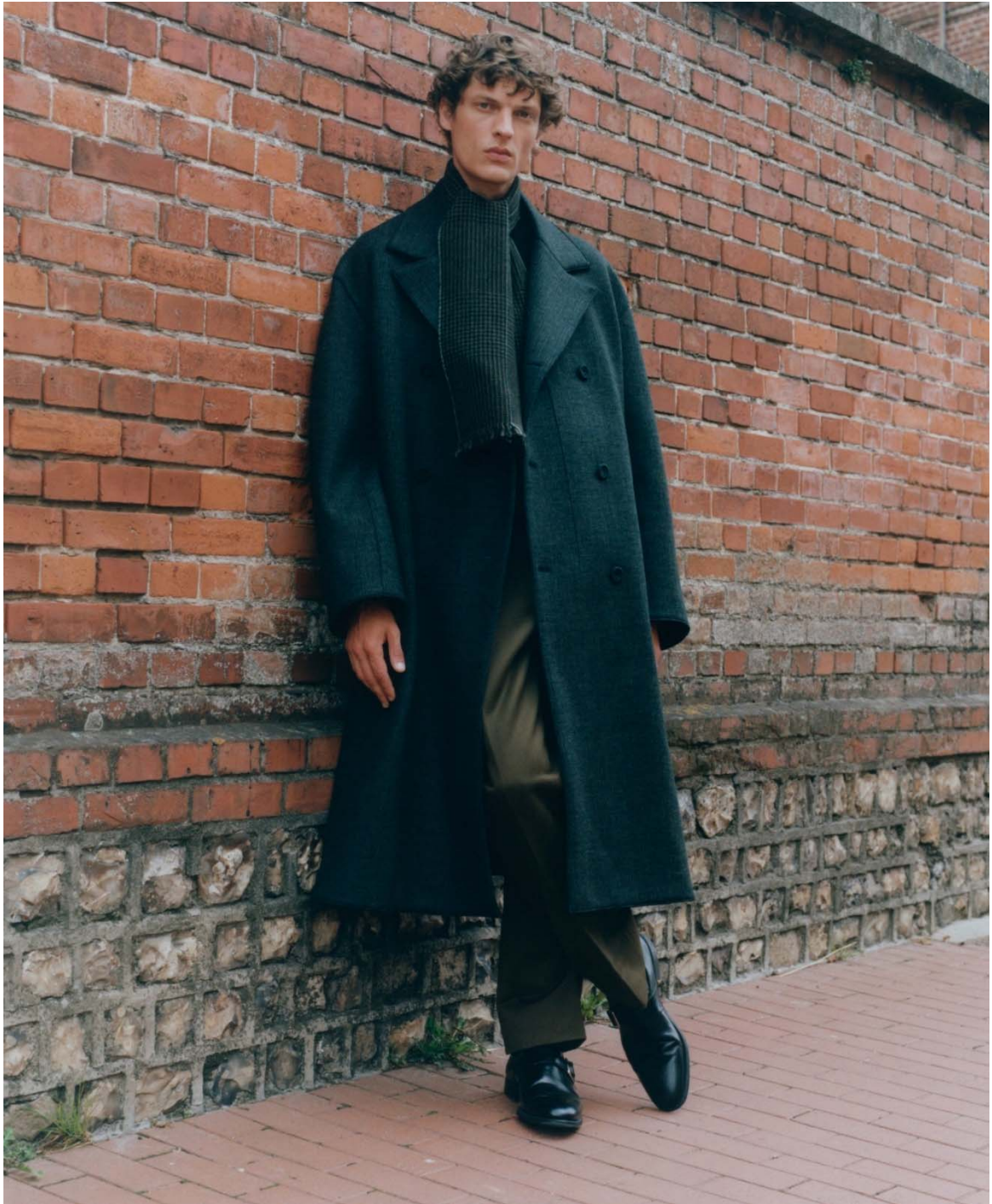
LE FIGARO Westbury Black