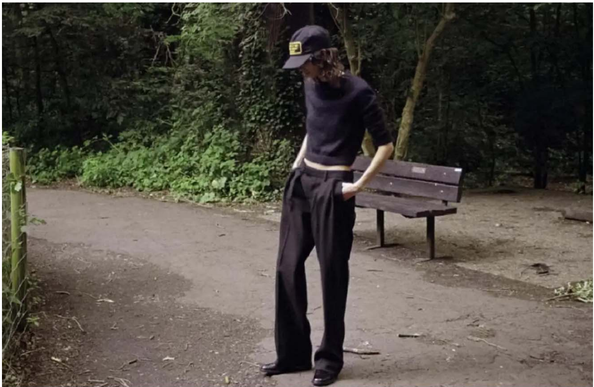
D La Repubblica – The Fashion Issue Mica Arganaraz Shannon Black