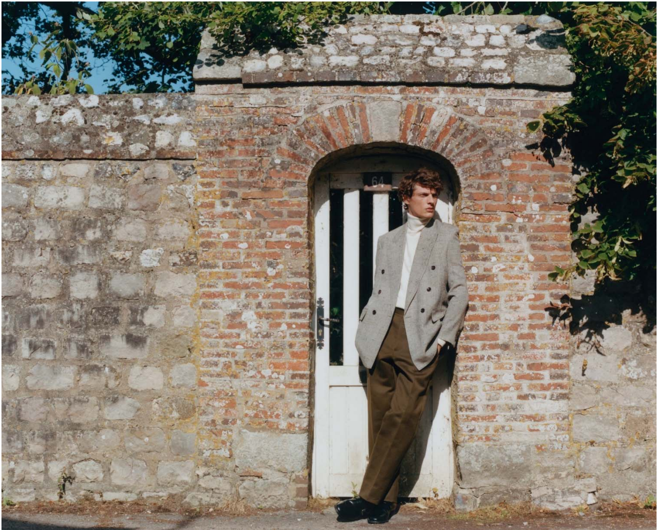
Le Figaro Westbury Black