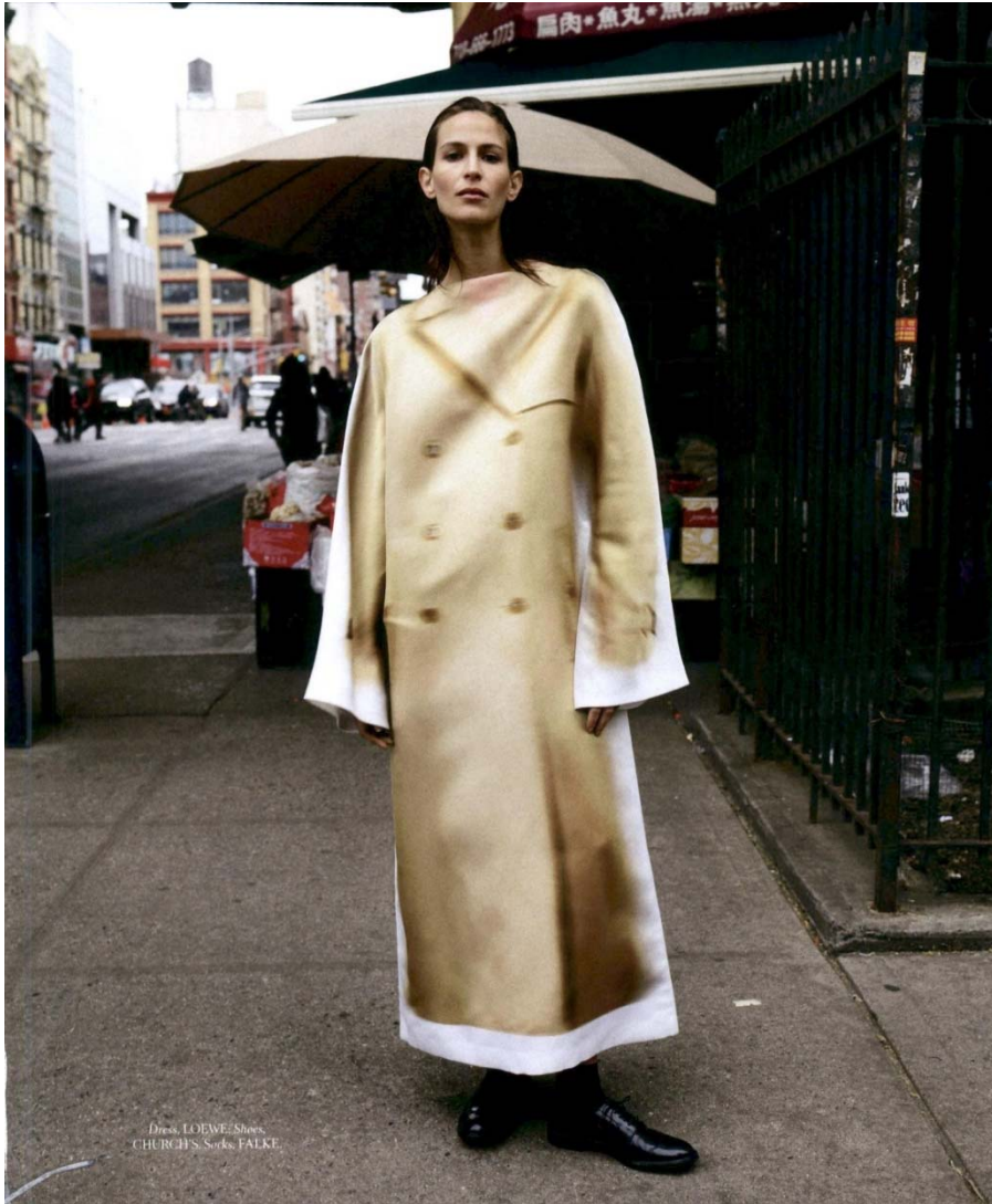
Harper's Bazaar US Shannon Black