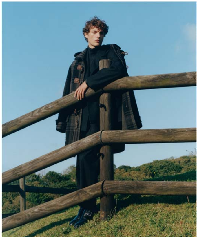
LE FIGARO Westbury Black