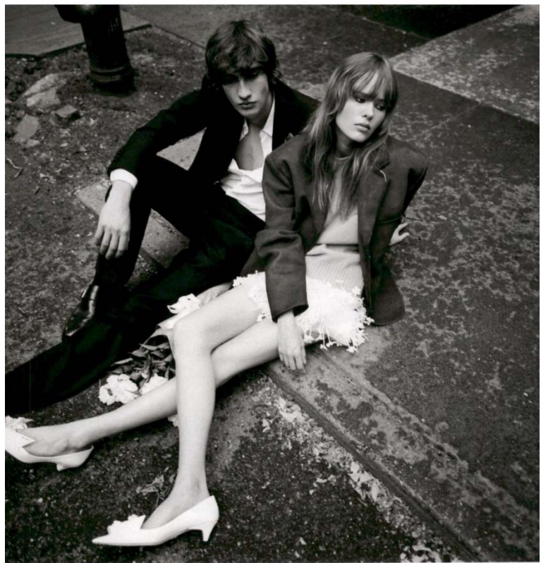
ELLE US Westbury Black