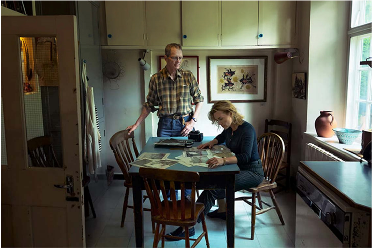
VOGUE US Kate Winslet Pembrey Black