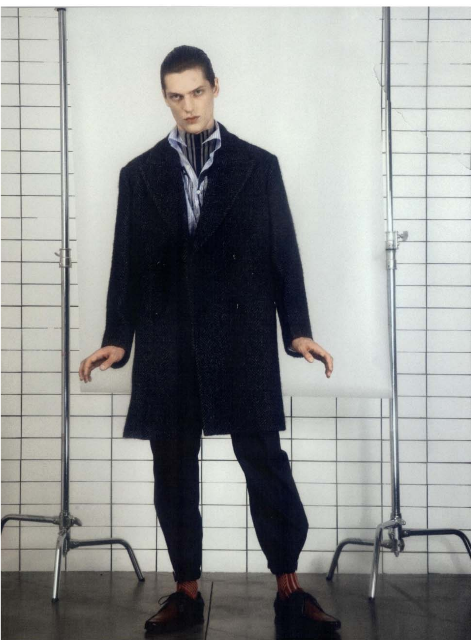
ITALIA - L'OFFICIEL HOMMES - PRADA UOMO 5DI8 - 01.03.18.jpg