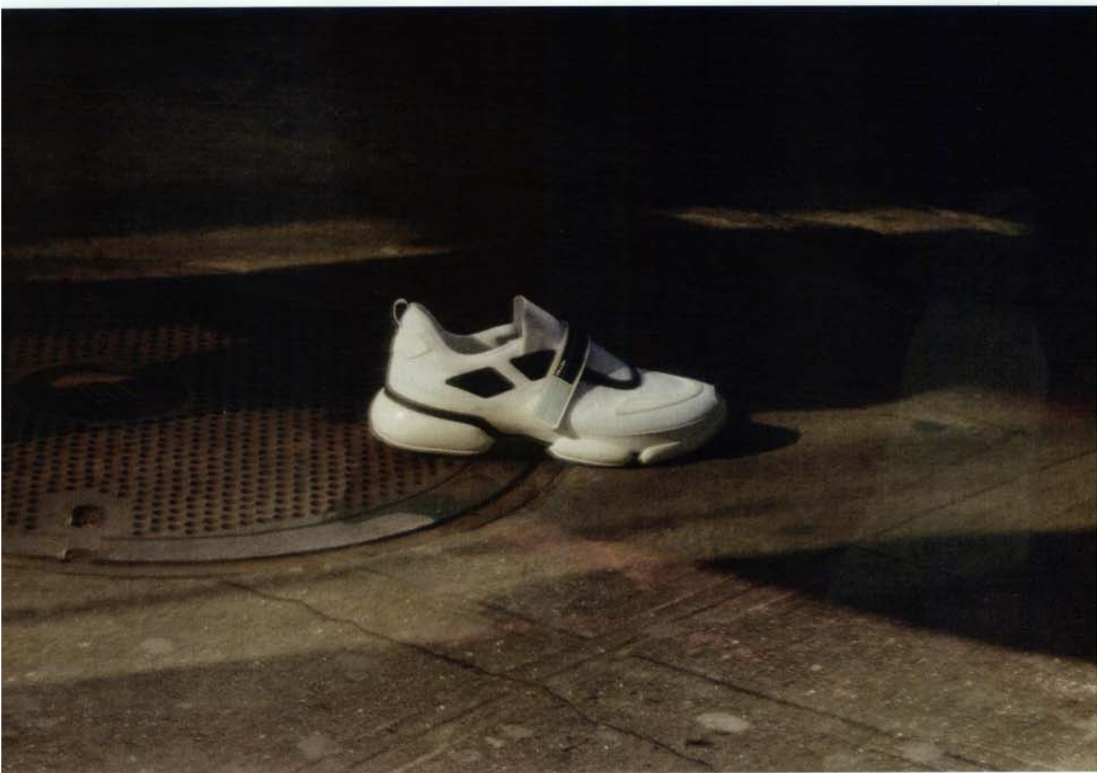
Sneaker di tessuto a rete e gomma con chiusura a strappo Prada