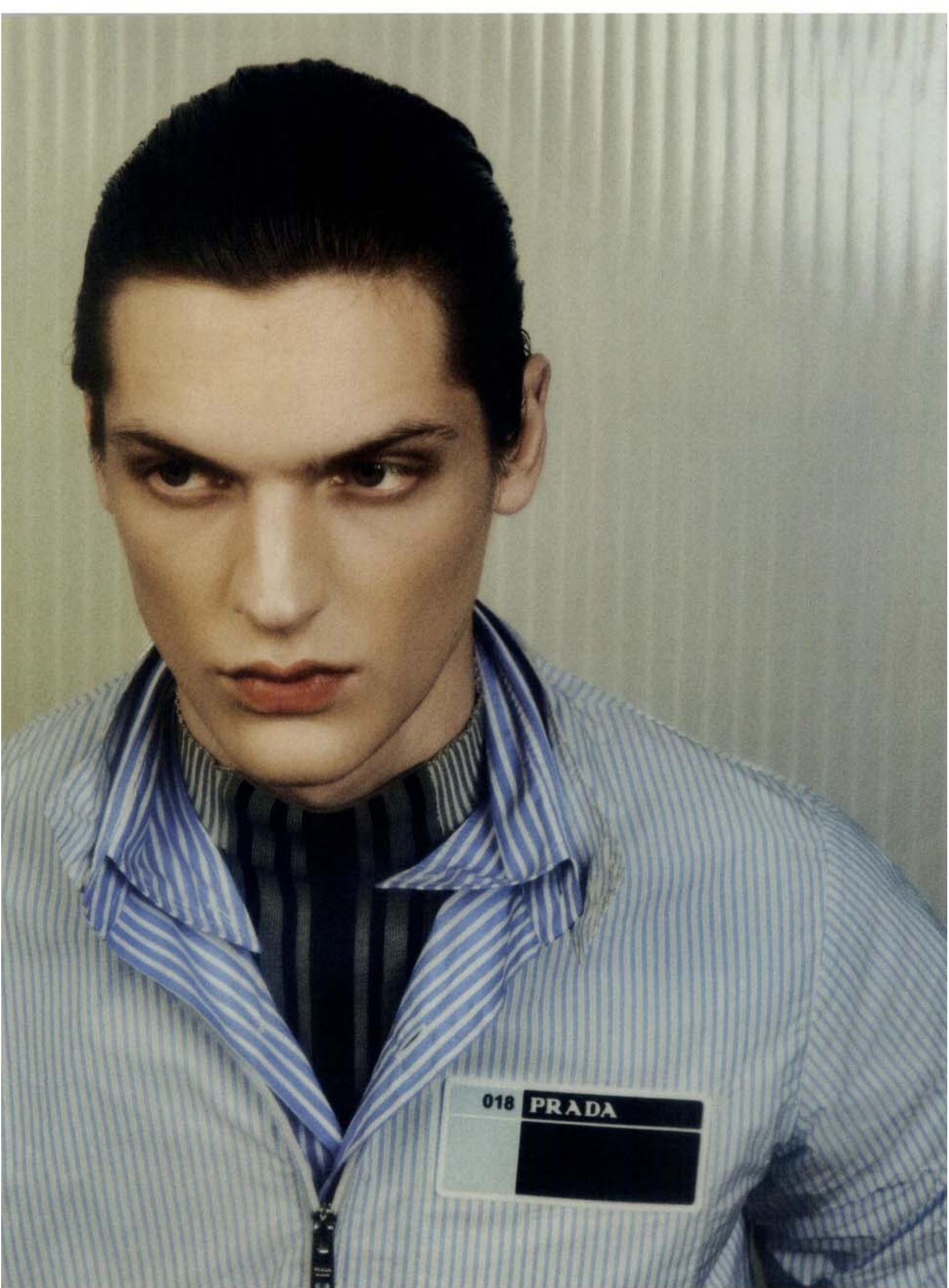
ITALIA - L'OFFICIEL HOMMES - PRADA UOMO 7DI8 - 01.03.18.jpg